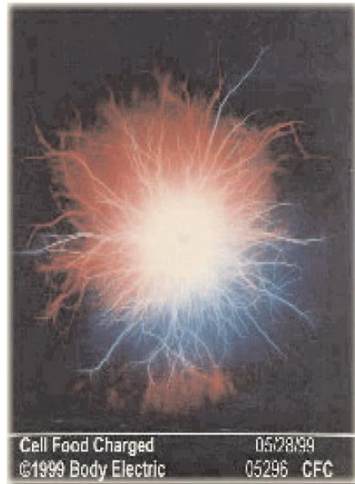
Nach der EES-Sitzung